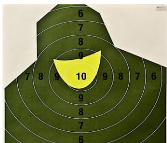
Pistolet centralnego zapłonu TARCZA NT 23