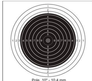
Tarcza karabin dowolny Kdw 50 m.

Karabin dowolny 10 strz. odległość strzelania 25 m.