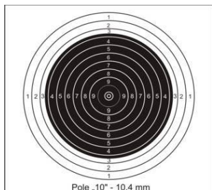
Tarcza karabin dowolny Kdw 50 m.

Karabin dowolny 10 strz. odległość strzelania 25 m.